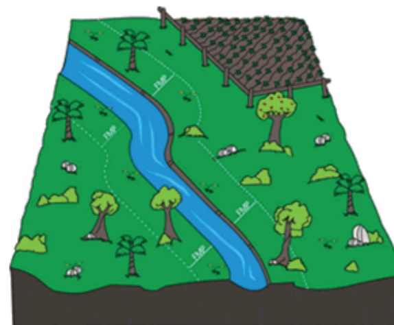
Ilustração 1 - Demarcação de FMP.